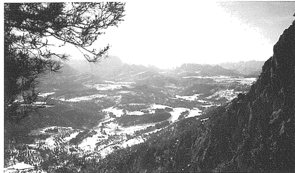
ARNES (Terra Alta)

BUTLLETÍ INFORMATIU núm. 23 - SETEMBRE 99